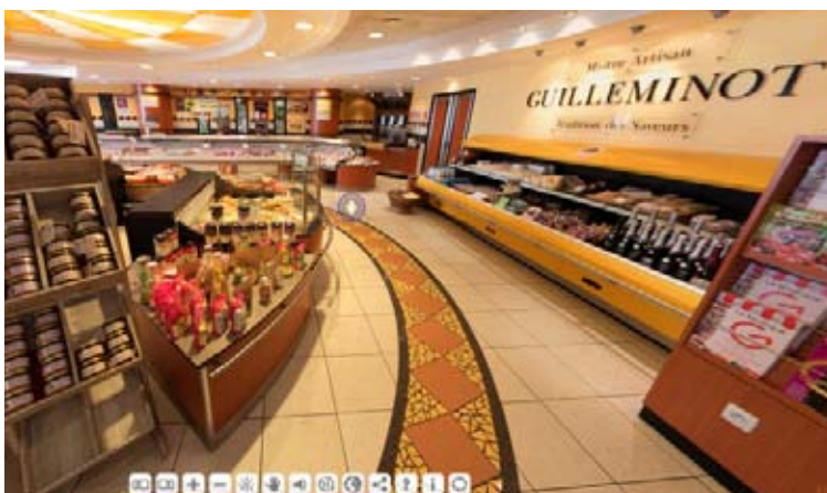
Le visiteur est immergé à l'intérieur de chaque commerce, comme ici Guilleminot.